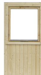
Modul med fönster 9x10, öppningsbart inkl. fönsterbleck

Art.nr. 5090 Vitmålat fönster Art.nr. 5091