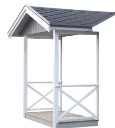
Modul Farstuväst 2,3

Kan endast placeras på en långsida. Art.nr. 5096