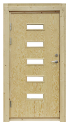
Modul dörr funkis

9x19, 10° med trycke och lås Vänsterhängd Art.nr. 5072 Högerhängd Art.nr. 5073