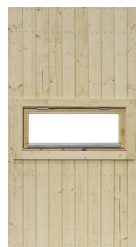
Modul med fönster 9x4, öppningsbart inkl. fönsterbleck

Art.nr. 5084 Vitmålat fönster Art.nr. 5085