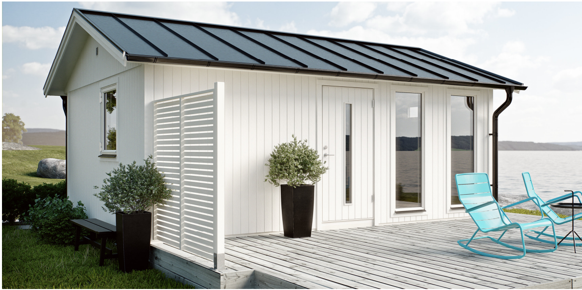
Friggeboden levereras obehandlad och kan vara extrautrustad

Störst i klassen. Maximera antalet kvadratmetrar. Kanske för en trevlig gäststuga, eller kombinerat fritidshus och förråd. I grundsatsen ingår 18 stycken väggmoduler. Dessa kan bytas ut mot valfritt antal fönster- och dörrmoduler och placeras var du vill.