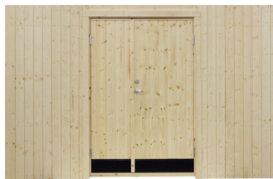
Modul med dubbel dörr

13x19 10° med trycke och lås Art.nr. 5104 15,3x19 10° med trycke och lås Art.nr. 5105 Motsvarar tre vanliga moduler och kan endast placeras på en gavel. Består av 2 moduler och 1 överbit. Modulerna väger ca: 23 kg st.