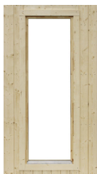
Modul med fönster 6x18, fast inkl. fönsterbleck

Art.nr. 5088 Vitmålat fönster Art.nr. 5089