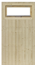
Modul med fönster 9x4, öppningsbart inkl. fönsterbleck

Art.nr. 5086 Vitmålat fönster Art.nr. 5087