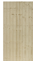
Ingår i grundsatsen

Modulerna på denna sida är 1085 mm breda och 2050 mm höga och väger mellan 15-26 kg. Dörr och fönster är ej medräknat.