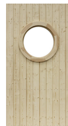
Modul med fönster 06, fast

Art.nr. 5082 Vitmålat fönster Art.nr. 5083