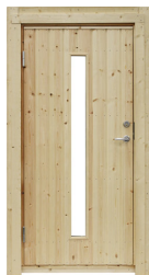
Modul dörr med avlångt fönster

9x19, 18° med trycke och lås Vänsterhängd Art.nr. 5074 Högerhängd Art.nr. 5075