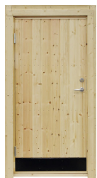
Modul dörr med rak panel

9x19, 10° med trycke och lås Vänsterhängd Art.nr. 5072 Högerhängd Art.nr. 5073