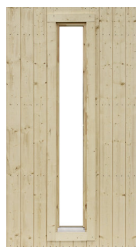
Modul med fönster 3x18, fast inkl. fönsterbleck

Art.nr. 5088 Vitmålat fönster Art.nr. 5089